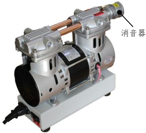
图 1 机械泵安装示意图

取出无油泵、消音器，将无油泵水平放置，消音器安装在机械泵出气口上，消音器安装位置如图 1 所示：