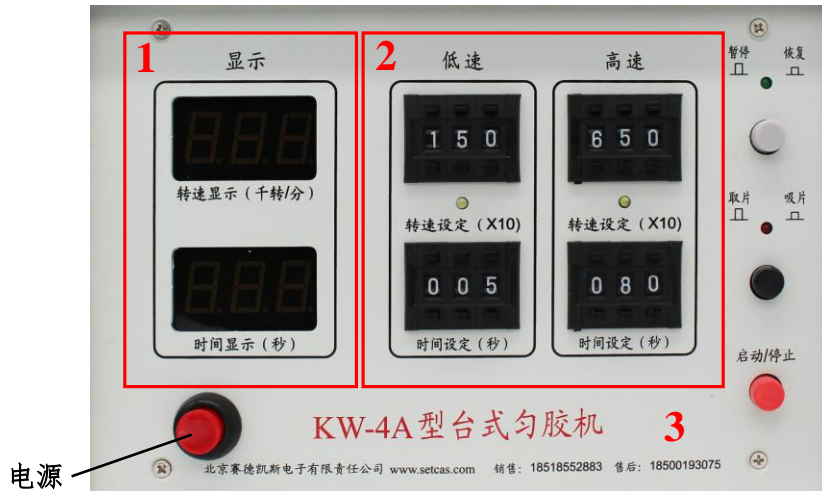
图 4 匀胶机操作板