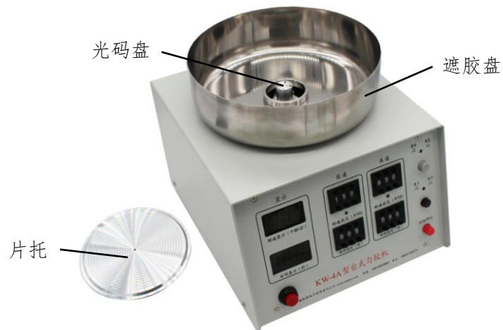
图 2 匀胶机安装示意图